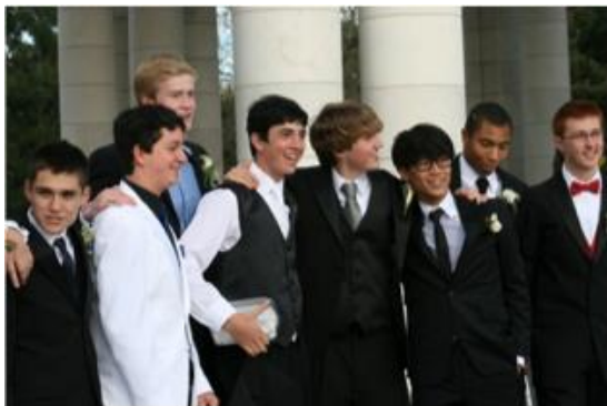
プロム前の記念写真