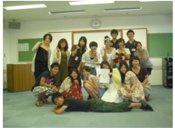
帰国後オリエンテーションにて留學した仲間たちとの再会 (筆者：最後列右から2人目)

この夏で、帰国してからちょうど5年が経つ。現在は同志社大学の大学院で流体力学について研究している。留學生活が何か特別今の自分の進路に直接影響を及ぼしているかと聞かれば、そんなことは全くない。今後、留學経験が何か役に立つかと聞かれても、それもわからない。ただ、今の自分の考え方、価値観はあの留學によって形成されたものであり、あの留學がなければ良くも悪くも今の自分はいないのだと思う。